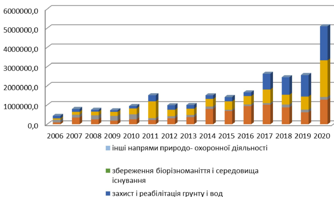
Рис. 2. Капітальні інвестиції на охорону довкілля у 2004-2020 рр.

Проведений аналіз показав, що між цими показниками є суттєва залежність. Таким чином, стає підвищення обсягів фінансування у охорону довкілля дозволяє впроваджувати нові технології і забезпечити зниження викидів і покращення стану повітря (рис. 3).