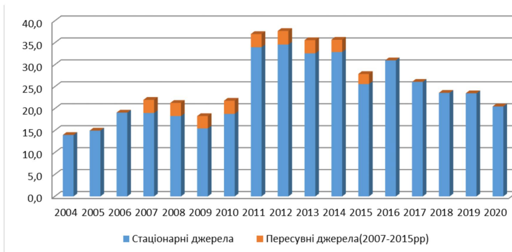
Рис. 1. Обсяг викидів діоксиду вуглецю 2004-2020 рр.